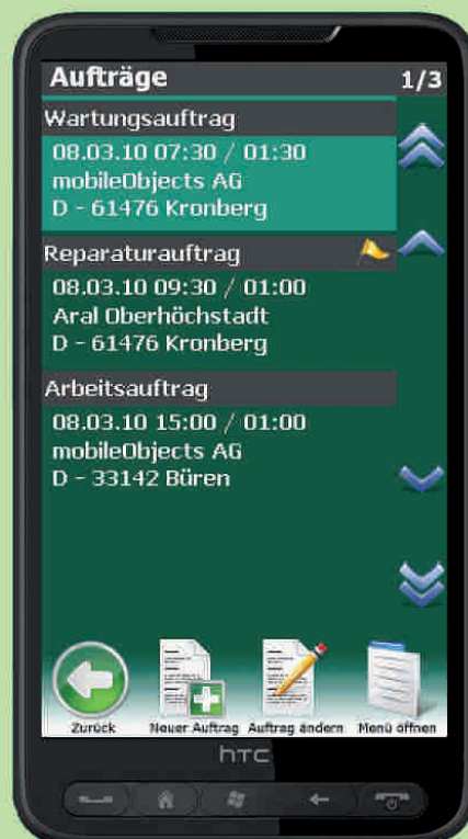
Endgerät für mobilen Kundenservice HTC HD2

Das Zusatzmodul mO – mobiler Kundenservice ermöglicht Ihnen und Ihren Mitarbeitern mit Hilfe spezieller Handys auch unterwegs auf Stammdaten und Aufträge im HWP zuzugreifen. Die Mitarbeiter können optimal gesteuert werden und sich per Navigationssoftware zum Kunden leiten lassen. Arbeiten lassen sich vor Ort dokumentieren, vom Kunden abzeichnen und per Knopfdruck an die Zentrale weiter leiten zwecks Rechnungsstellung.